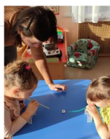
«Воздушный футбол» (старшая группа)