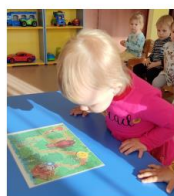
«Колобок» (ясельная группа)

Цель: укреплять мышцы губ и языка, тренировать их подвижность, укреплять мускулатуру щек. Ребята выполняли артикуляционную гимнастику.