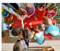
Пальчиковая игра «Веселый ёжик» (младшая группа)