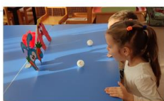
«Накорми Смешариков» (старшая группа)