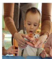
«Сдуй перышко» (младшая группа)