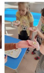
«Задуй свечу» (подготовительная группа)