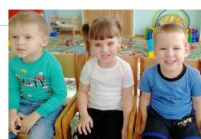
Артикуляционная гимнастика: упражнение «Заборчик» (младшая группа)

День артикуляционной гимнастики «Веселая гимнастика для язычка»