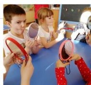
Артикуляционная гимнастика: комплекс упражнений для губ (старшая группа)