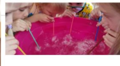
«Шторм на озере» (средняя группа)