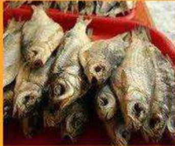
Сушёная рыба (Исландия)