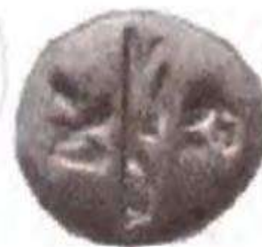
Лидийская монета с клеймом, удостоверяющим вес. 7-й век до н. э.

2. Завоевания персов. Предводителем персов был Кир . Он поднял восстание против мидийского царя и, разгромив его, стал владыкой обширного государства. С многочисленным войском Кир начал покорять персидские пле-