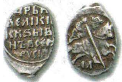
Копейка времён Елены Глинской

Летописец записал, что Василий III выбрал Елену Глинскую «лепоты ради ея лица». Однако молодая княгиня отличалась не только красотой, но и сильным характером. Став вдовой в 25 лет, она не опустила руки: властная и честолюбивая правительница прежде всего расправилась с братьями своего мужа — Юрием Дмитровским и Андреем Старицким, которые могли бы угрожать ей и её сыну. Юрия схватили и убили «страдальческой смертью». Андрей был обвинён в мятеже и тоже погиб.