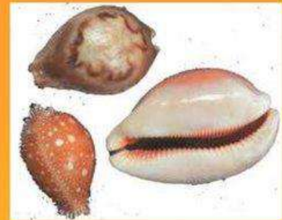
Раковины Каури (Приморье)