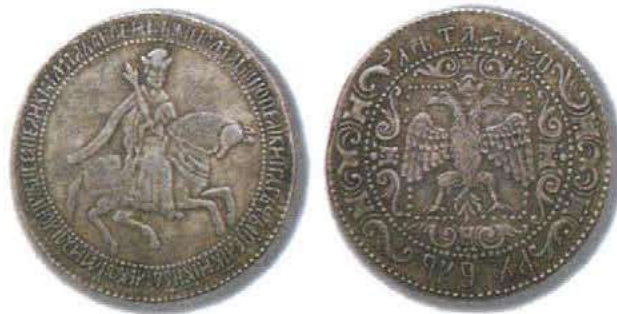
Серебряный рубль времён царя Алексея Михайловича

Непосредственным поводом для выступления москвичей послужили слухи о новом налоге. 25 июля в различных концах города появились прибитые к столбам «письма». В них перечислялись имена бояр и крупных купцов, повинных «в измене» государю. Чтение воззваний собрало большую толпу, которая, всё более возбуждаясь, двинулась в село Коломенское — к царю. Царь в это время был в церкви Вознесения. Алексей Михайлович был вынужден выйти к толпе. Подданные требовали уменьшить подати и выдать «изменников на убиение». Монарх уговаривал народ успокоиться и обещал «учинить розыски и указ». Пока монарх «тихим обычаем» говорил с восстав-